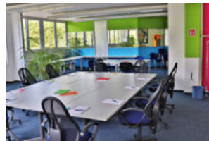
Raum 302 & 303 London & Madrid