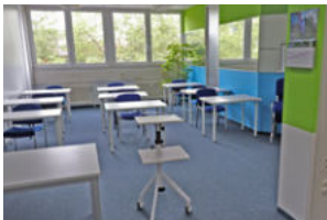
Raum 302 London