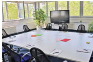
Raum 303 Madrid