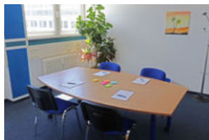
Raum 308 Mexiko

Die größeren Räume können je nach Bedarf bestuhlt werden und eignen sich für alle Arten von Meetings, Konferenzen, aber auch für Yoga- oder Wellness-Einheiten. Die beiden kleinen Räume sind ideal für kleine Meetings oder Schulungen.