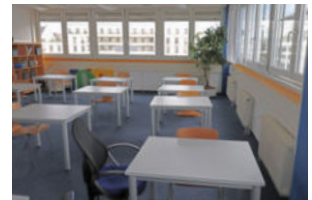
Raum 305 Frankfurt